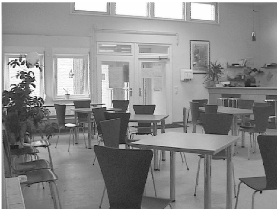
Fixpunkt, Hanover. Questo Centro prevede una stanza di accoglienza, una zona d'attesa e un caffè. Gli utenti possono inoltre avere accesso ai servizi sanitari.

Centro per l'iniezione controllata in Niddastrasse, Francoforte. Ci sono panche di acciaio inossidabile per l'iniezione e la stanza può essere usata da un massimo di 12 persone alla volta. Le regole vietano che gli utenti si assistano a vicenda mentre s'iniettano la dose.